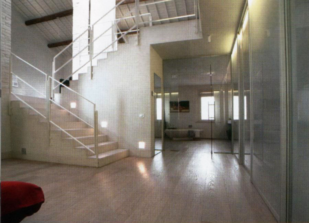
A LATO: sopra, stanza da bagno a vista e, sotto, due poltroncine di provenienza orientale. A FRONTE: vasca Agape, sanitari Duravit e rubinetteria Boffi.