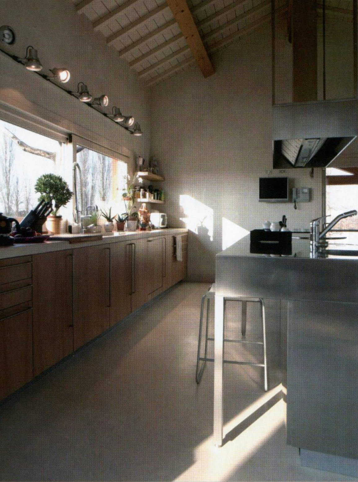
A LATO: la cucina, di Boffi, collegata all'edificio principale grazie a un corpo vetrato adibito a zona pranzo (sotto).