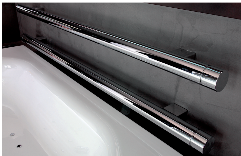
La zona-lavabi (modello Mimo 2 di Antonio Lupi). Qui sopra: un dettaglio della vasca firmata dai designer Ludovica e Roberto Palomba per Kos e dei due radiatori a tubolare di Tubes. Nella pagina accanto, il box doccia caratterizzato da un'elegante porta a scorrimento in vetro nero realizzata su misura

Minimal chic. Questo, sinteticamente, lo stile che si percepisce nel modus operandi dell'architetto Stefano Severi che dal 1994 ha il suo studio di progettazione a Carpi. Molteplici i suoi interventi di ristrutturazione e restauro oltre all'interior design di abitazioni, negozi, disco-bar, ristoranti, hotel, tra cui il Touring Hotel di Carpi del gruppo Anna Molinari-Blumarine. Posizionata su una collina, i tre livelli in cui è suddivisa questa residenza si fanno portavoce di un'architettura lineare ma ricca di dettagli esclusivi e su misura. Al piano terra la zona giorno con una veranda che conduce alla piscina; al seminterrato è stato creato uno spazio dedicato al benessere, una spa dotata di sauna e bagno turco, mentre la zona notte è distribuita al primo piano