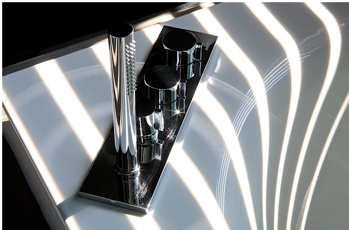
I sanitari sospesi da terra in ceramica (modello Galassia Sao2 di Boffi) e la rubinetteria